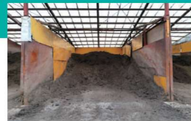
B 副原料倉庫(木くず) 微生物の活性を促進するため、良質な木くずを購入し、搬入された廃棄物と混合します。