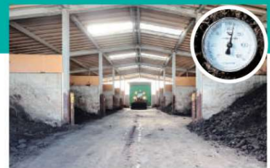
D 一次発酵槽 発酵槽では発酵環境を整えるため、エアブローにより強制発酵を促進します。これにより一次発酵では高温となり、植物に悪い影響を与える雑菌や昆虫の卵、雑草の種子を死滅させ、有機質が分解・発酵されます。