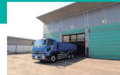
A 原料倉庫 搬入された廃棄物は品目・性状ごとに各ピットに分類保管します。