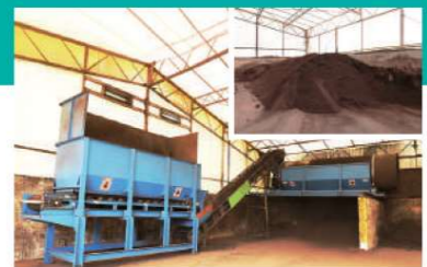
G トロンメル さらに需要先の要望に応えるべく、篩機(トロンメル)で粒径10mm以下の製品(堆肥)も製造しています。