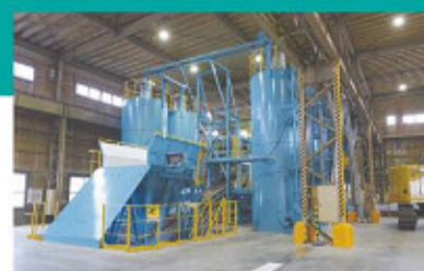
D ペレガイア（混練機）

高圧ミスト噴霧装置で飛散防止液および消臭剤を噴霧することにより飛散や悪臭を防止します。