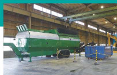
B トップスクリーン