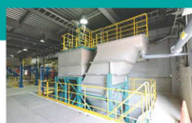
J 沈殿分離（ラメラセパレーター）

凝集剤を添加し汚泥を固化します。2回の凝集処理で大きなブロック（かたまり）にします。