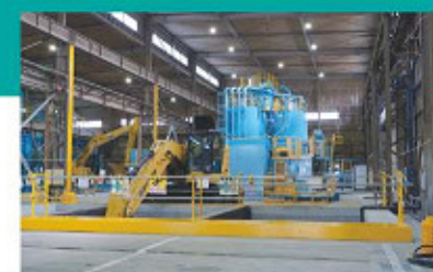
A 受入槽（低・中含水）